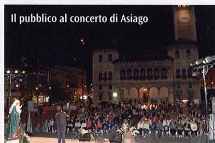
Il pubblico al concerto di Asiago

Siamo disponibili anche a valutare nuovi interessamenti per proporre il festival in altre località.